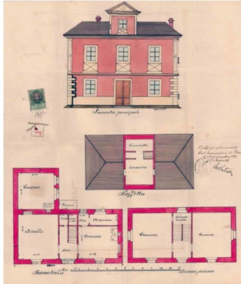
Načrt vile Alme v Piranu, ki ga je 28. decembra 1895 odobrila občina Piran.

Začetke turizma v Portorožu najboljšo povezuje z zdraviliško dejavnostjo, saj so že v 16. stoletju s solinskim blatom in slanico zdravniki bolnike z revmatičnimi obolenji. O prisotnosti zdraviliškega turizma pričča že leta 1830 zgrajena vila San Lorenzo, ki je služila kot prenočišče in okrevališče avstro-ogrskim častnikom. Zaradi vse večjega pretoka bolnikov, ki so si poleg okrevanja želeli tudi prijetnega in sproščene bivanja, se je kmalu porodila zamisel o ustanovitvi orga-