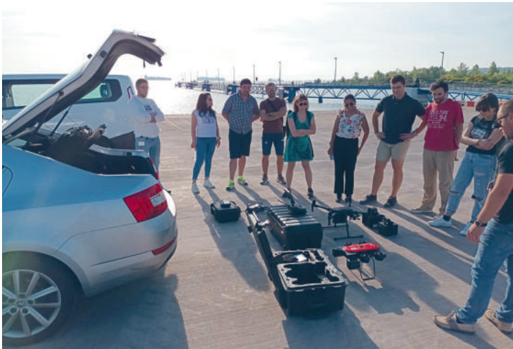
Eno izmed področij, ki ga študentje raziskujejo, je tudi preiskovanje v pomorstvu s podvodnimi droni.

Več informacij o študijskem programu The Surveying & MARiTime internet of thingS EducAtion je dostopnih na: https://www.smart-sea.eu/