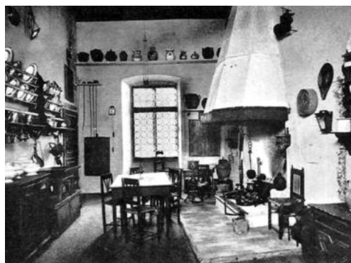
Meščanska kuhinja v palači Belgramoni Tacco, 1924