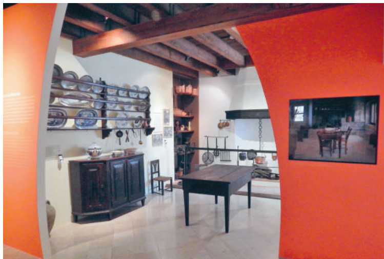
Srečanje lakote in izobilja, 2016