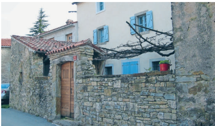
Obnovljena tradicionalna hiša v Kastelcu

Bivalne razmere so se v naslednjih stoletjih spreminjale postopoma, vzporedno z gospodarskim razvojem. Hiše so se ločile od hlevov in drugih kmetijskih objektov. Stanovanje se je razdelilo na kuhinjo, vežo in eno ali več sob. Obodni zidovi so se stanjšali, okna povečala. Hiše so pretežno enonadstropne, z okni v obliki pokončnih pravokotnikov, zbranih na eni od daljših fasad. Stanovanjska in gospodarska poslopja so se razvila v vzdolžni smeri tako, da se je vsak prostor odpiral na osončeno in zatišno stran. Osnovna stavbna celica z ravnimi linijami, položno streho, plitkimi napuči in slepimi fasadami, prekритimi z apnenim ometom, deluje strogo in zaprto. Zunanjšično popostrjo šele arhitekturni elementi: baludurji, ganki, dimniki, kavade, okenski in vratni okvirji, portali, konzole, posneti hišni vogali, niše, stavbno pohištvo..., ki se pojavljajo v mnogoterih zanimivih oblikah in določajo stavbe in naselja kot individualne enote.