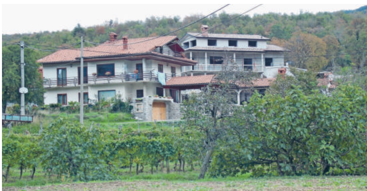
Novogradnje v vplivnem območju naselbinskega spomenika Hrastovlje