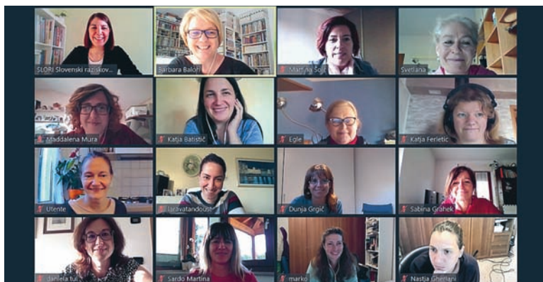
Na izobraževanju so učiteljice osnovnih šol s slovenskim učnim jezikom v Italiji skupaj načrtovale cilje, vsebine in dejavnosti pri pouku slovenščine.

Slovenski raziskovalni inštitut že načrtuje nov program na področju jezikovnega izobraževanja in didaktike slovenščine, tokrat za vzgojiteljice in vzgojitelje v vrtcih, saj se je ponovno izkazalo, da je pedagoški kader motiviran in si želi medsebojnega sodelovanja, izmenjave mnenj in primerov dobre prakse.