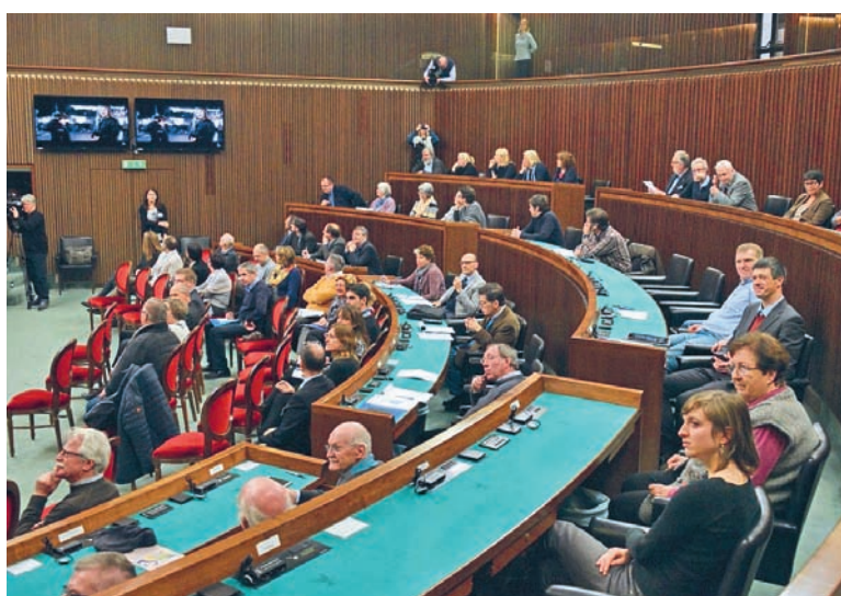
Druga deželna konferenca iz leta 2017 (arhivski posnetek)