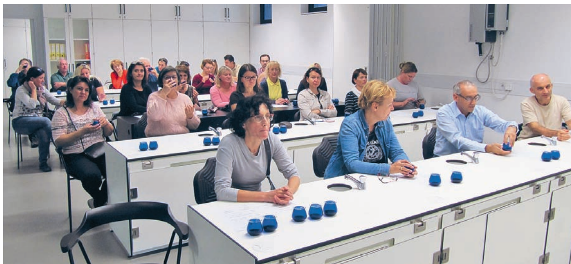
Senzorično preizkušanje oljčnega olja.

V teh mesecih osebje Laboratorija Inštituta za oljkarstvo ZRS Koper zaključuje v mednarodnem prostoru zelo odmeven raziskovalni projekt OLEUM, ki je uspel nadgraditi obstoječe analize metode za ugotavljanje kakovosti in pristnosti oljčnega olja. Z novimi orodji bo tako prispeval k preprečevanju goljufij (potvorb) oljčnega olja, ki pogosto prerastejo v medijske škandale in tako vplivajo na nezaupanje potrošnikov v oljčne izdelke.